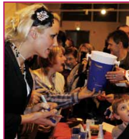
Séance de dédicaces pour Élodie Gossuin